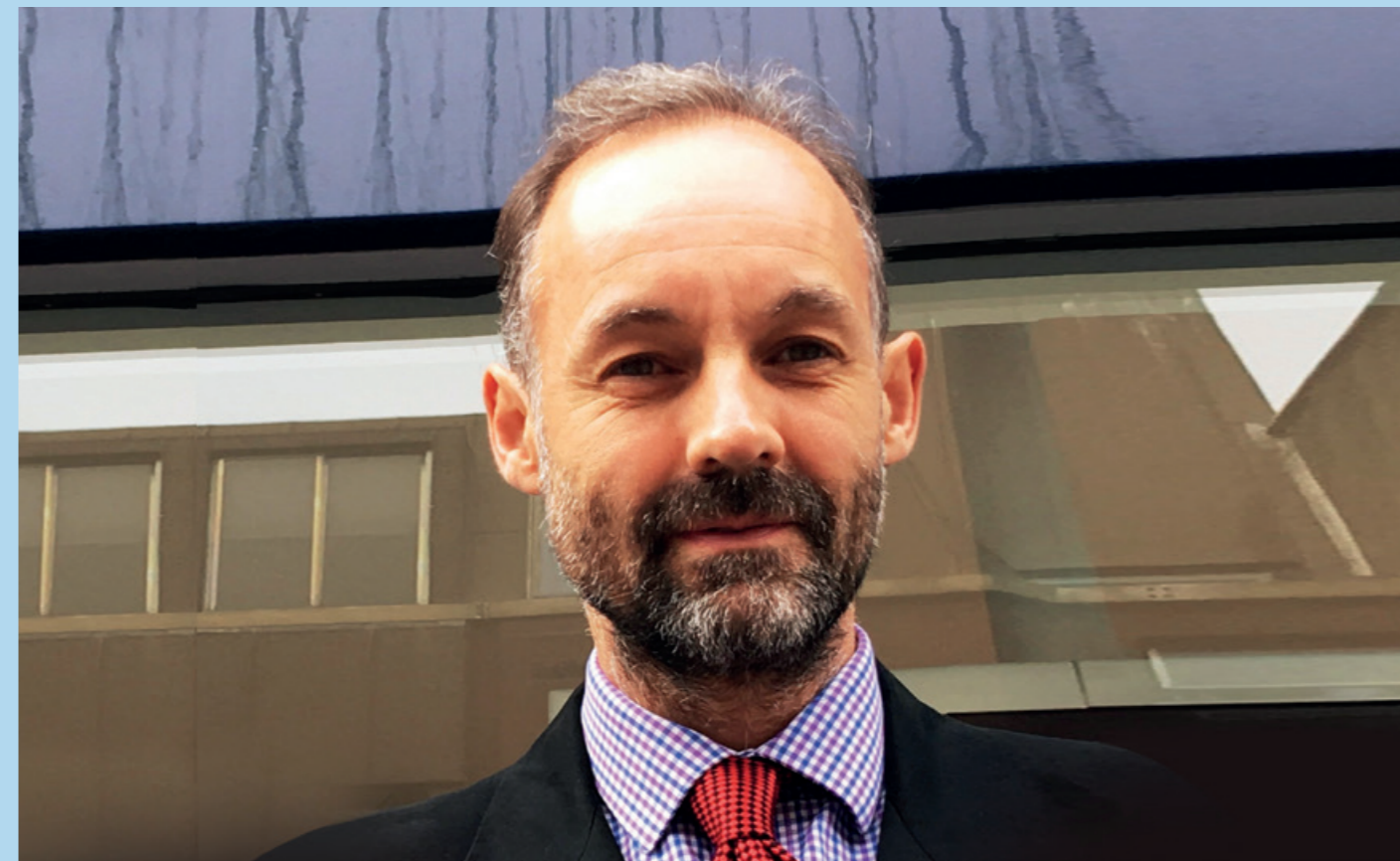
Charles Byrne Cyfarwyddwr Cyffredinol, Y Llog Brydeinig Brenhinol